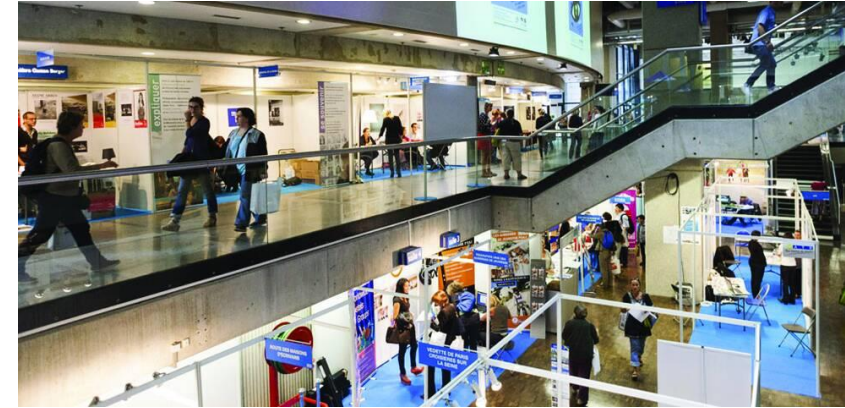
Foyers d'exposition sur 3 niveaux