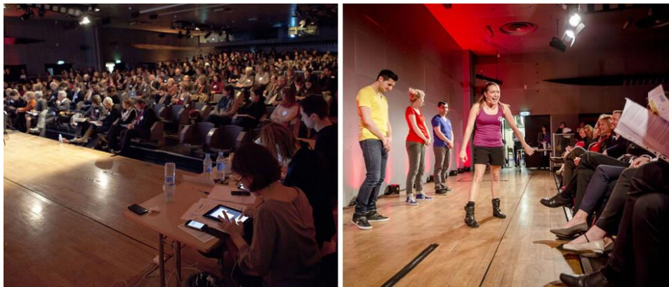
Salle Louis Armand : 2 x 210 places