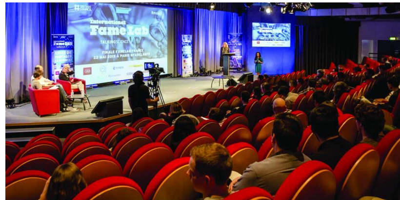
Auditorium : 360 places