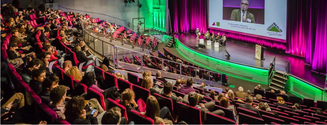
Amphi Gaston Bergé : 900 places + 16 PMR